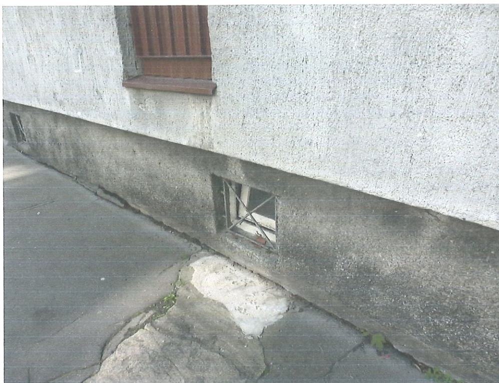
Fot.4 . Elewacja szczytowa- zniszczona blacharka, powierzchniowe ubytki w tynku