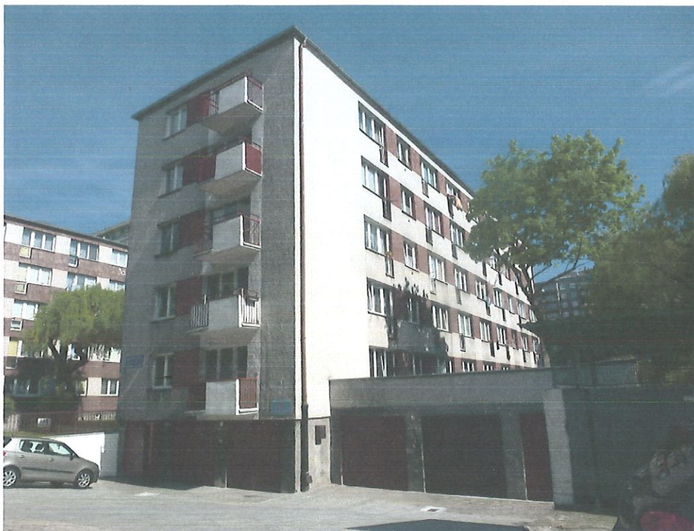
Fot.6 . Studzienki piwniczne do remontu, kraty do wymiany