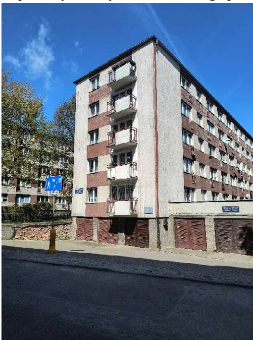
Rys. nr 1.1 widok elewacji szczytowej (południowej), budynku przy ul. Barnima 9-10