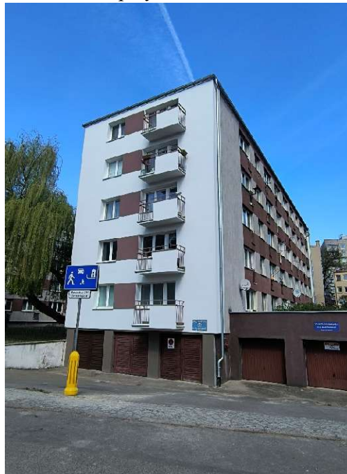
Rys. nr 2 widok elewacji szczytowej (południowej), budynku przy ul. Barnima 5-6 wykonanej w roku 2025 r.