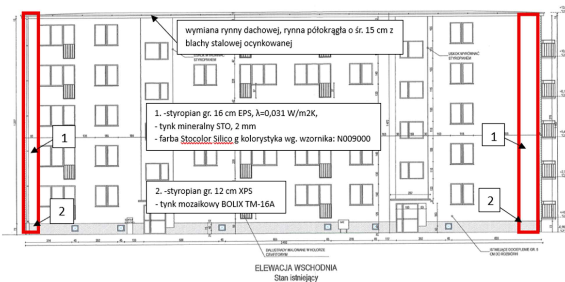
Rys. nr 8.2 elewacja wschodnia- zakres robót objętych niniejszym postępowaniem