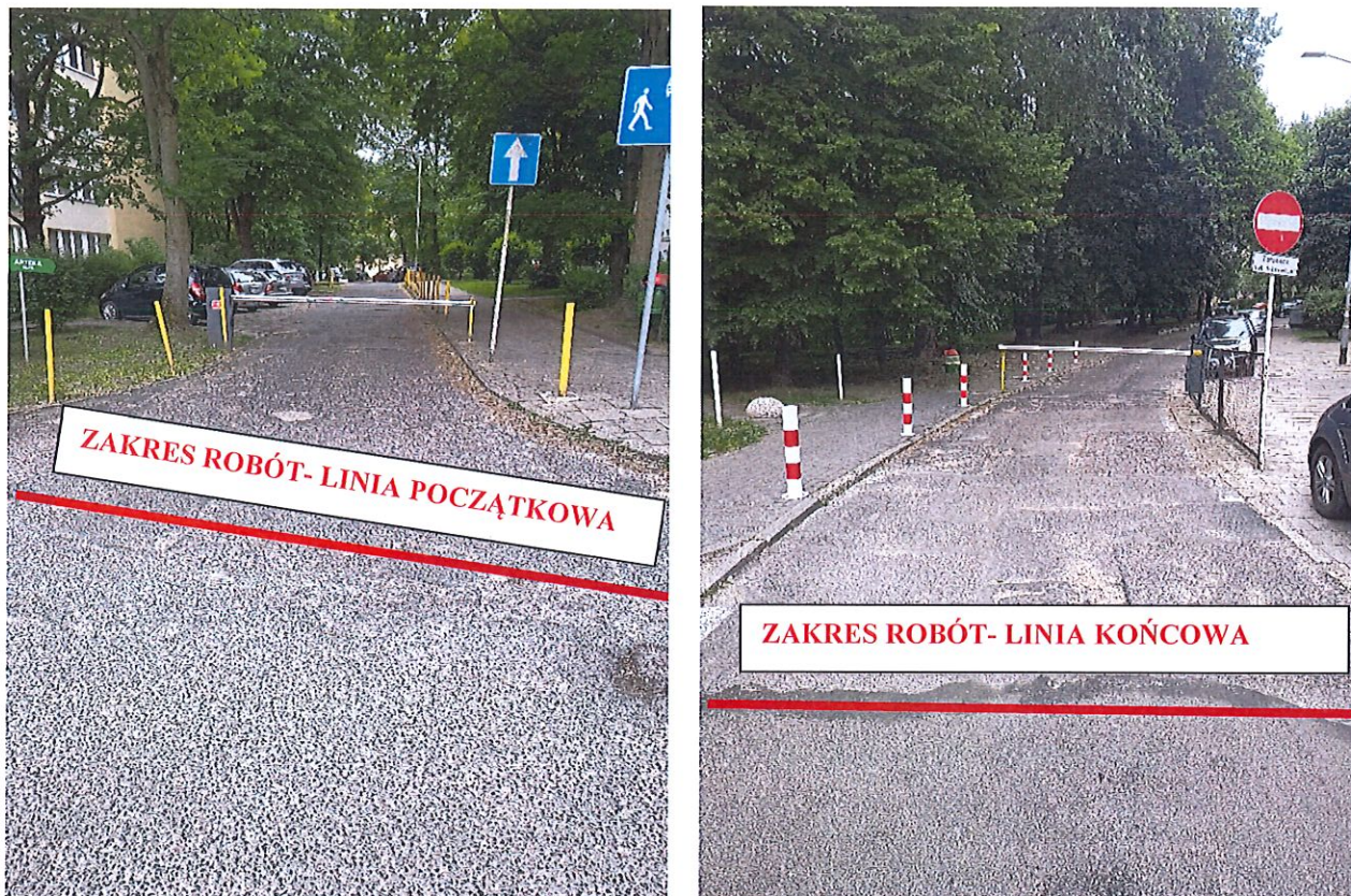
Rys. nr 1-2 graficzne zaznaczenie zakresu robót- początek i koniec drogi wewnętrznej, Szczecin ul. Odzieżowa 13-20

Przedmiotem zamówienia jest wykonanie robót budowlanych polegających na remoncie nawierzchni drogi osiedlowej oraz infrastruktury towarzyszącej na terenie nieruchomości położonych w Szczecinie przy ul. Odzieżowej 13–20, zgodnie z zakresem oznaczonym na rysunku technologicznym stanowiącym załącznik do postępowania (rys. technologiczny nr 1).