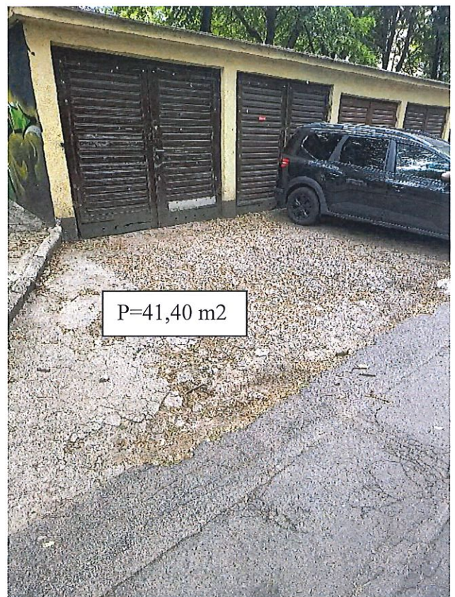
Rys. nr 4.3.1-2 zakres robót związany z remontem nawierzchni przy garażach – nawierzchnia istniejąca betonowa