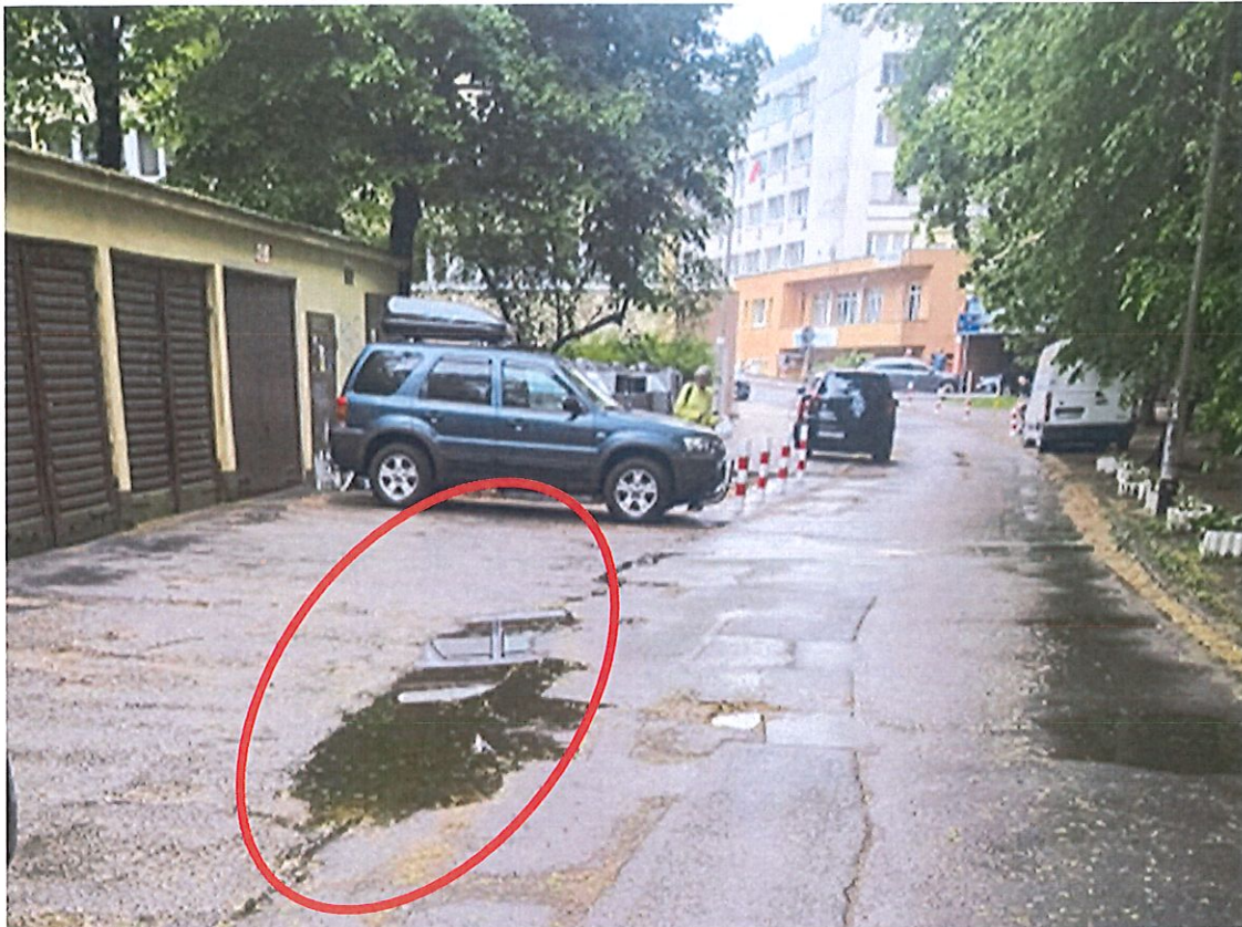
rys. nr 4.4.1 widoczna zastoin wody do likwidacji- zaznaczenie kolorem czerwonym