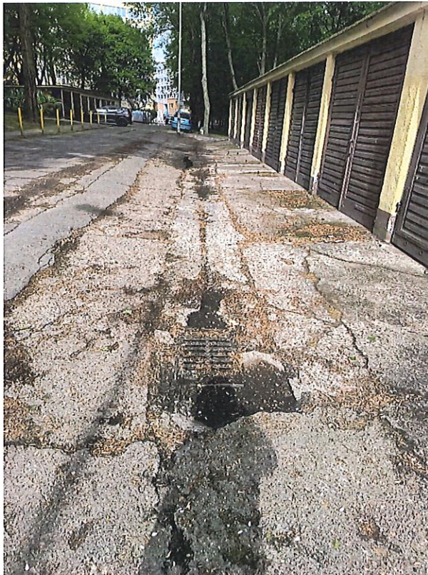
Rys. nr 4.5.1 widok istniejących studzienek kanalizacyjnych do regulacji po profilowaniu podłoża