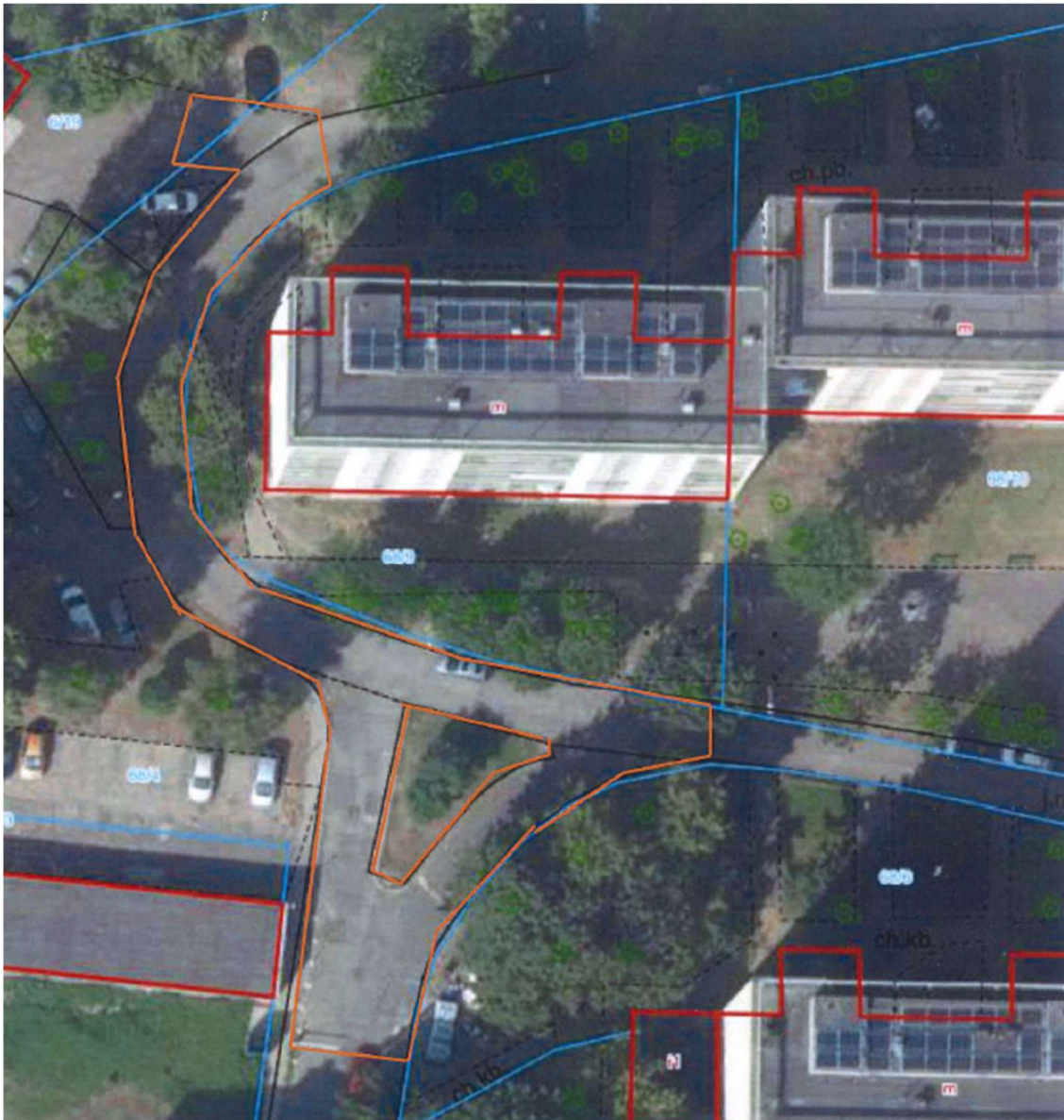
Rys. nr 1 – zakres robót (zaznaczenie kolor pomarańczowy), widok z góry na fragment osiedla od ulicy Grażyny

2. Po zakończeniu robót teren należy uporządkować i przywrócić do stanu użytkowego.